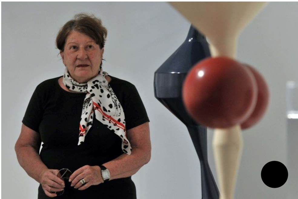
Margarita Paksa, artista paradigmática de los años 60 y de la vanguardia del arte conceptual.

"La política siempre está metida en nosotros, de una manera muy fuerte y cruel. Forma parte de nuestro cuerpo y pensamiento. Así como yo adoro la desmaterialización, no puedo evitar meterme intensamente en la política" , explicó recientemente en el Centro Cultural Recoleta.